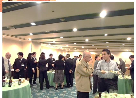
別室に移動して、 懇親会を開きました。