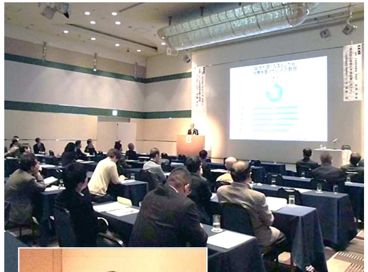
約 60 名が参加しました

この後、別室に場所を移して懇親会を開催。おいしい料理に舌包みを打ちながら和やかに歓談しました。