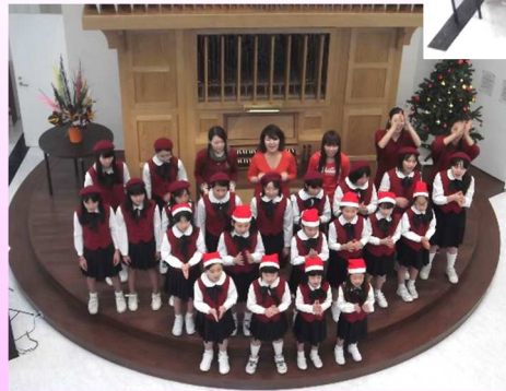
此花少年少女合唱団と フィオリムジカーリの 皆さん