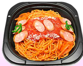
← 自家製トマトソースのナポリタン

懐かしい味わいのナポリタンです。トマトソースと ケチャップをベースにチリソースなどを合わせた 程良い辛みと酸味、野菜と肉の旨味のあるソースで 麺をしっかり炒めました。380円