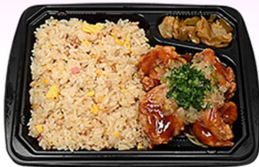
↑ねぎソースで食べる 鶏唐揚げ&焼めし

炒飯と鶏唐揚げを組み合わせ たお弁当です。鶏唐揚げの上 には、ごま油を加えた風味の 良いねぎソースをかけまし た。480円