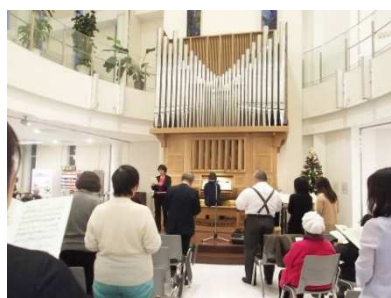
みんなで讃美歌を合唱