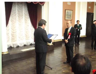
3月25日の授賞式の様子