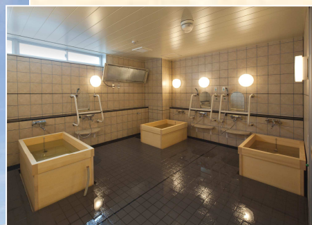
ゆったりした広い浴室