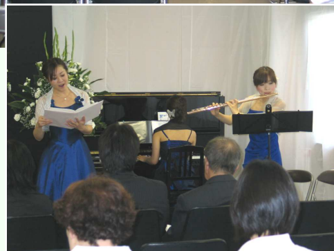
「アンサンブルちようちよ」の皆さんによる演奏