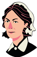
フローレンス・ ナイチンゲール